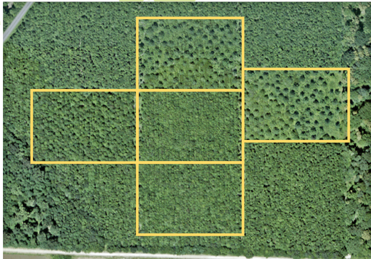
Illustration d'un dispositif Chênes