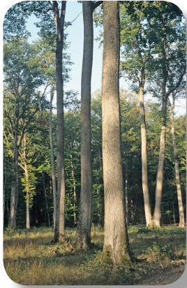
Chênes sessile et pédonculé

Quatre groupes opérationnels traitent ces essences : un groupe Chênes et un groupe par essence résineuse.